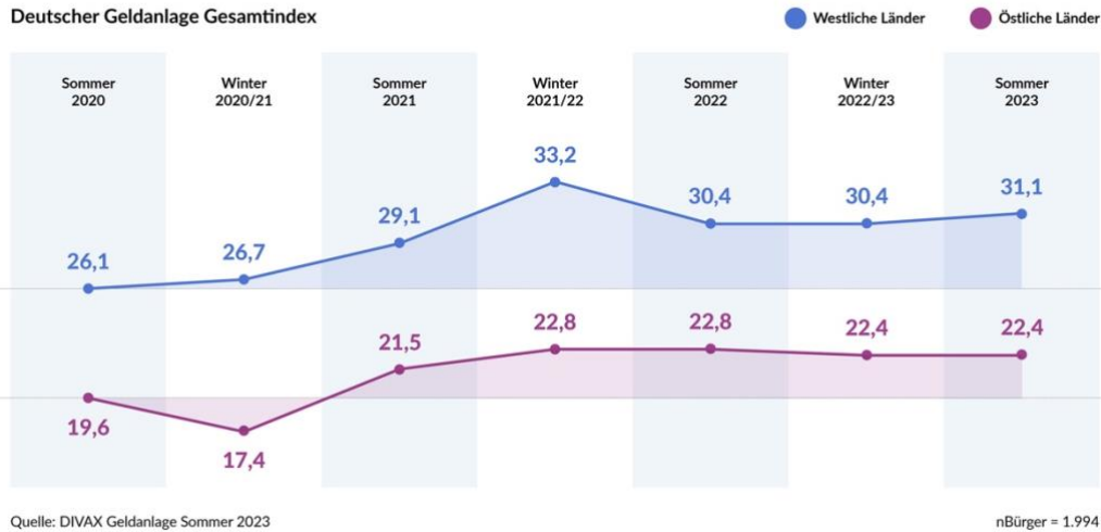
Abb. 1: Zeitliche Entwicklung des Deutschen Geldanlage-Index (DIVAX-GA) seit Auflage nach alten und neuen Bundesländern. Die jeweiligen Index-Werte berechnen sich als arithmetische Mittel der beiden Einzelindizes „Aktuelle Lage“ und „Künftige Erwartungen“. Die zugrundeliegenden Befragungen wurden von INSA-CONSULIERE im Auftrag des DIVA durchgeführt (Stand: 31.07.2023), n=1.994.

Der Geldanlage-Optimismus (DIVAX-GA) misst das Stimmungsbild der Menschen in Deutschland zum Thema Geldanlage und kann Werte zwischen 100 und -100 annehmen. Er befindet sich seit Start der Erhebung auf optimistisch hohem Niveau. Die etwas weniger hohen Werte im Osten stehen im Zusammenhang mit dem Wohlstandsniveau insgesamt. Im Osten wie im Westen hat sich das Stimmungsbild in den letzten drei Jahren verbessert.